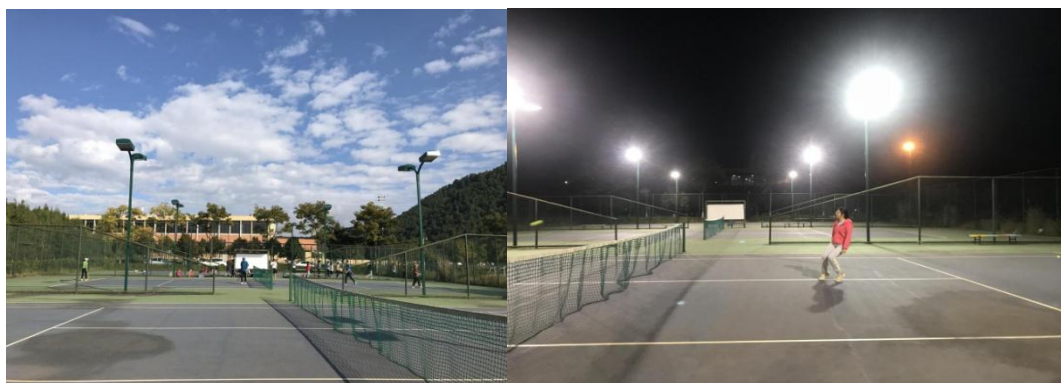
图 为 云 南 大 学 呈 贡 校 区 网 球 ( 场 地 ) 设 施