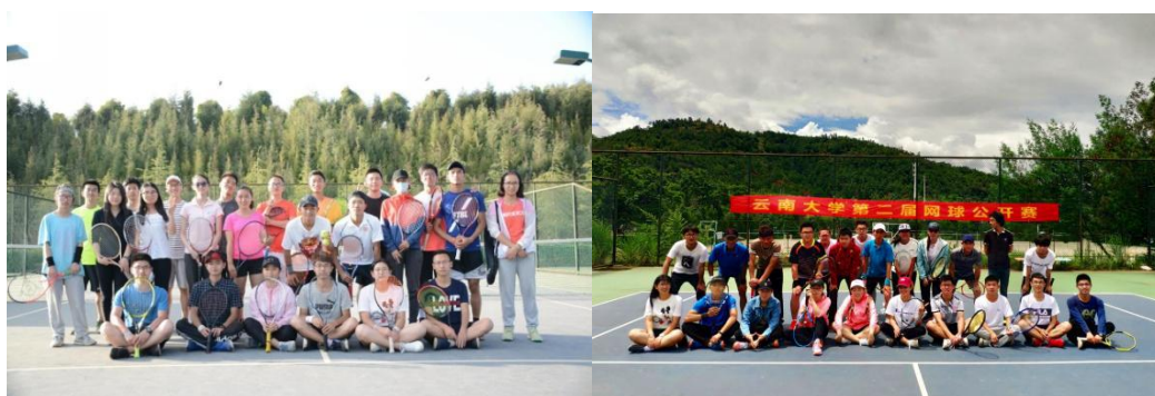
图为学生们参加云大网球公开赛

精神，激发大学生参加体育锻炼的主观能动性，同时结合我校历年以来深厚的网球文化底蕴，在 2017 年 6 月由校团委，体育学院，云大网球社共同举办了云大历史上规模最大的一次网球比赛，参赛人数多达 200 余人。2018 年云大网球公开赛继承优良传统，赛出了云大学生的风采。与此同时，在云大“周末联赛”火热进行的背景下，网球俱乐部也积极与昆明市的各个网球俱乐部进行交流，提高了学生们的网球技术水平，并对网球俱乐部的运营有了深刻的了解。昆明市业余网球联赛中也出现了越来越多云大网球爱好者的身影。学生们时常邀请其他学校和队伍来学校交流，做到了周周有比赛。