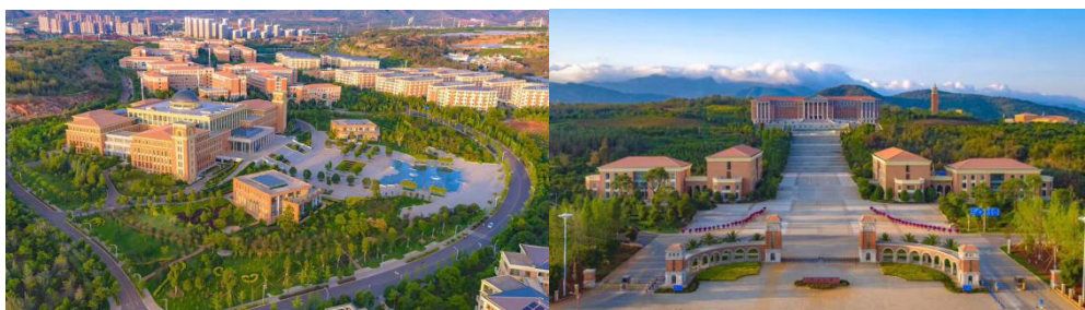
图为云南大学呈贡校区

云南大学始建于 1923 年，时为私立东陆大学，1934 年更名为省立云南大学，1938 年成为国立云南大学，是我国西部边疆最早建立的综合性大学之一。1946 年《不列颠百科全书》将云南大学列为中国最具世界影响力的 15 所大学之一。改革开放后，学校取得了长足的进步。1978 年云南大学被国务院确定为全国 88 所重点大学之一。1996 年首批列入国家“211 工程”重点建设大学。2001 年列入西部大开发重点建设院校。2004 年成为教育部和云南省人民政府重点共建高校。2006 年被教育部评为本科教学优秀学校。2012 年成为国家“中西部高校基础能力建设工程”和“中西部高校提升综合实力工程”实施院校。2016 年被列入国家“一省一校”工程重点建设院校。2017 年被列入世界“双一流”建设高校。