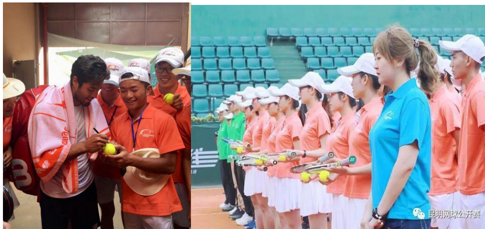
图为学生参与昆明公开赛志愿者服务

我校地处昆明，交通便利，网球文化氛围浓厚，每年云南省大部分赛事都在昆明举行，网球的梯度建设合理，有良好的后备资源。学校关于网球文化的建设不仅仅在网球教学方面，学校更注重可以让学生全方位，立体的感受网球文化的魅力。在2017年4月，学校组织了130位不同学院的同学以志愿者，司线，场服等不同身份参与到昆明网球公开赛这个国际性的网球大赛中，让学生与国际球星亲密接触与交流，学院还积极与加拿大专业网球学校对接，进行学生培养合作，与国际化教育接轨。