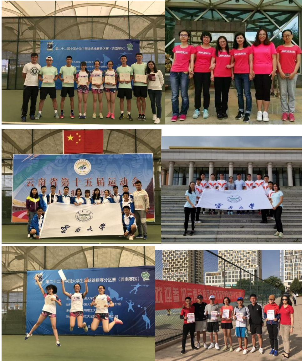
图为云南大学网球队参加各类网球比赛