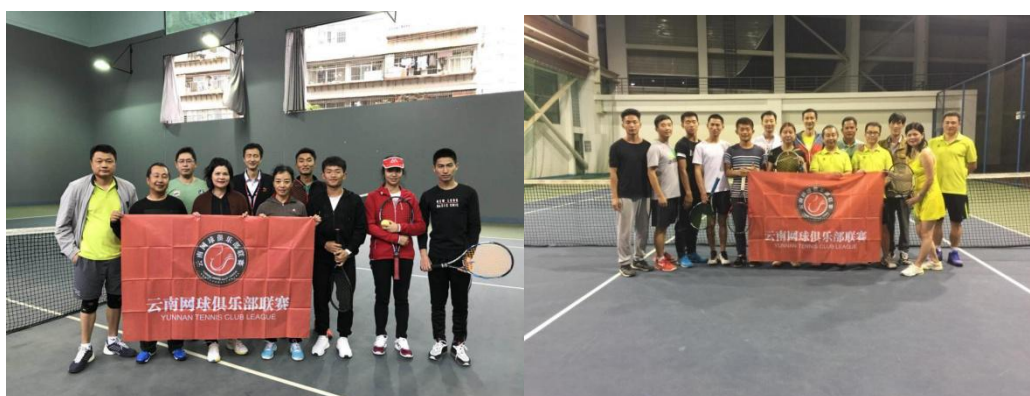
图为学生与昆明市各网球俱乐部交流