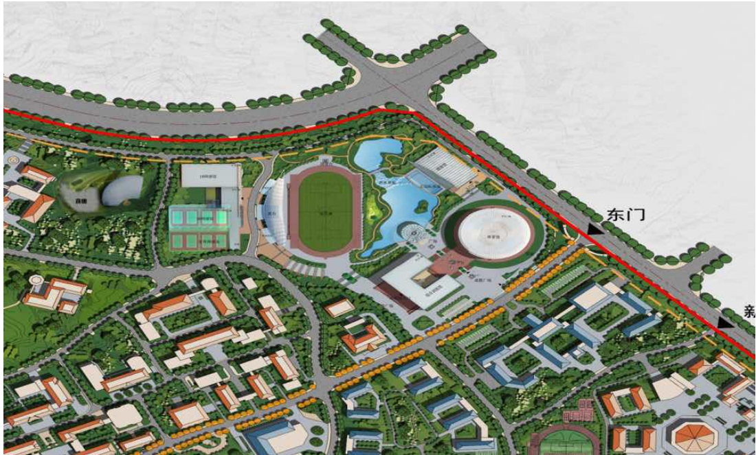
图为云南大学呈贡校区二期工程在建的体育中心效果图

云南大学呈贡校区二期建设已开工，学校着眼于未来发展的需要，规划设计了云南大学体育中心，分布在呈贡校区的东北部，面积充裕，数量众多，能够覆盖多种体育项目训练用馆，全部采用现代化装备。