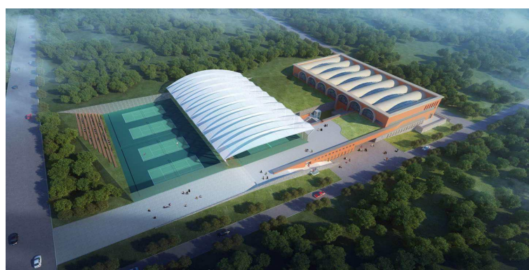
图 为 云 南 大 学 呈 贡 校 区 二 期 工 程 即 将 建 设 的 体 育 中 心 鸟 瞰 图