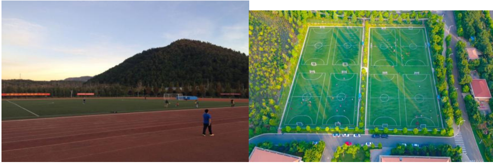
图为云南大学呈贡校区配套设施建设