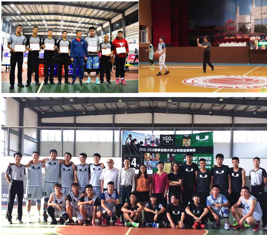
图为云南大学篮球教练参加裁判及各类培训活动