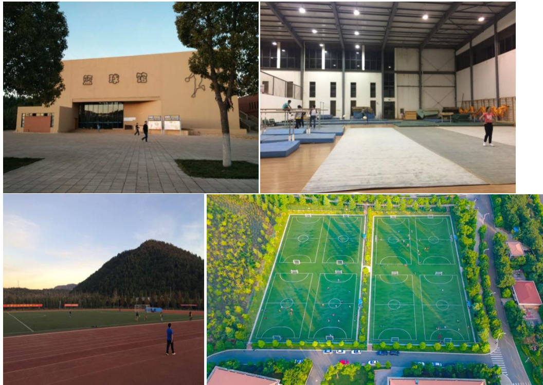
图为云南大学呈贡校区一期工程建设的部分场馆（场地）设施