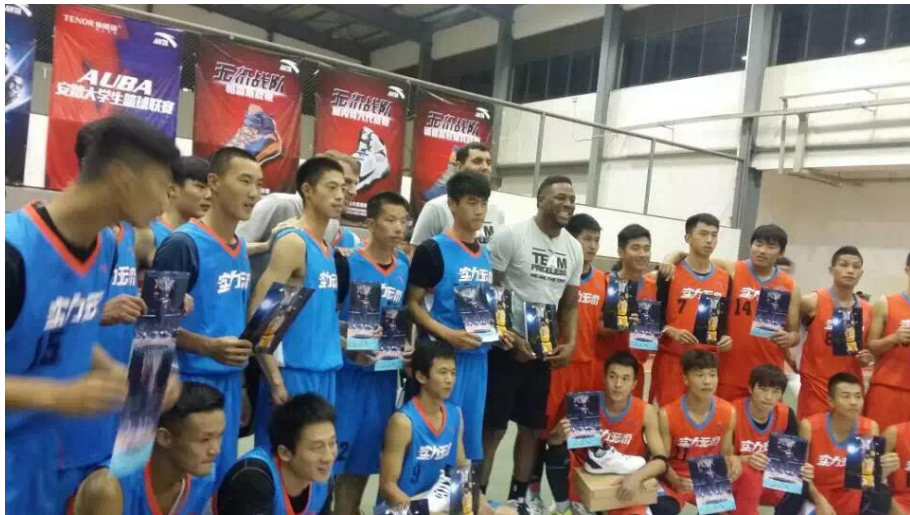
图为在云南大学举办的 NBA 嘉年华活动