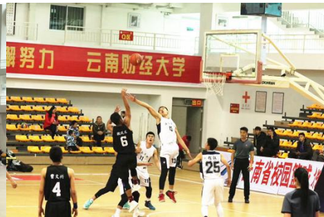
图为云南大学篮球队运动员风貌