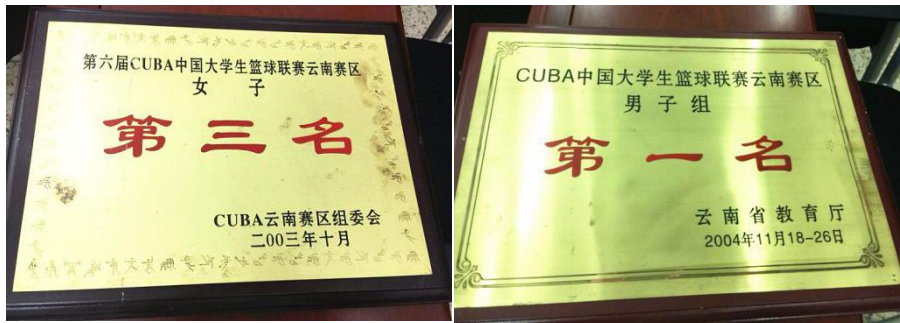
图为云南大学男女篮球队参加各类赛事获得的奖杯