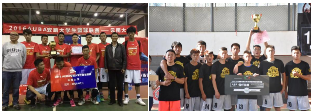
图为云南大学每年一届的“云大杯”篮球赛

为响应学校的“阳光体育”组织机构的号召，云南大学校园篮球活动开展呈现出勃勃生机，学生活动表现得积极踊跃，主要表现在每年一届的迎新篮球赛、三人篮球赛、体育文化周的趣味篮球活动、与校外比赛交流、篮球俱乐部等，形成了以教练员牵头、运动队员为骨干、各级各类赛事为主题的大型篮球文化平台。与此同时，以学院为单位的各类比赛迅速展开，各类篮球社团进一步扩展与完善；针对篮球运动的健美操、啦啦操队伍也逐步壮大。积极有效地推动了校园篮球文化的发展。