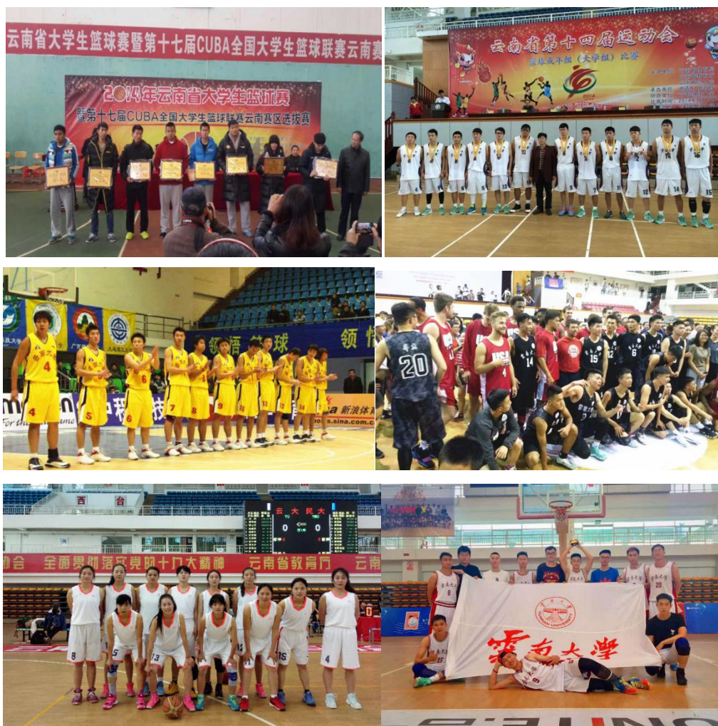
图为云南大学男、女篮球队参加各级别的篮球比赛