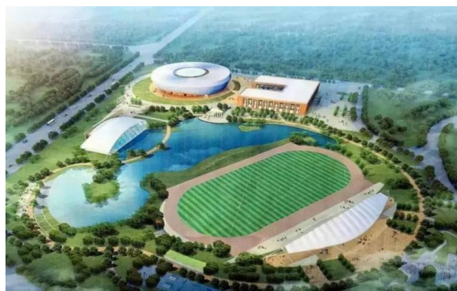
图为云南大学呈贡校区二期工程即将建设的体育中心鸟瞰图