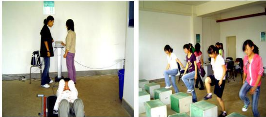
图为本科学学生参加学生健康体质测试工作