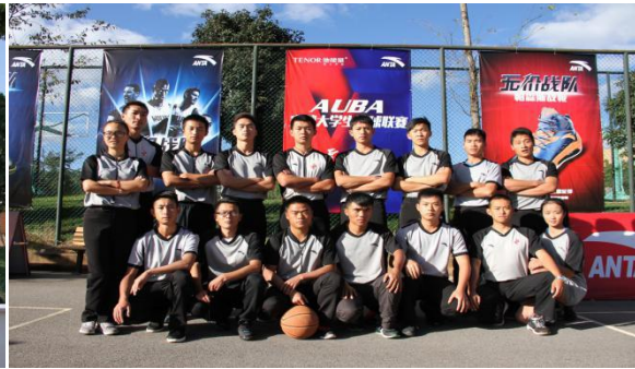
图为在云南大学每年举办的 U 联赛